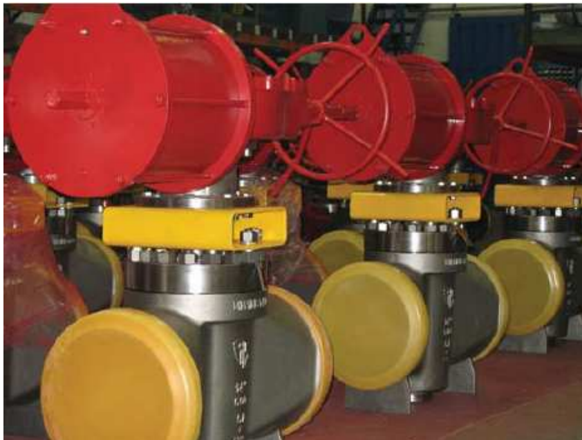
Versandfertige Hochdruckventile in einem Lager von MTS Valves in Nordspanien

Entlang der Nordküste Spaniens ist die Landschaft von üppig wachsendem Grün geprägt, das im starken Kontrast zu den trockenen Gebieten im Süden des Landes steht. Bilbao und die umliegenden Städte bilden mit einer Vielzahl von Metallgießereien und Produktionsstätten das Industriezentrum Spaniens mit der höchsten Unternehmensdichte.